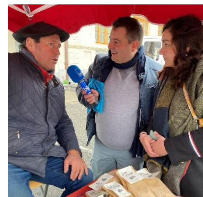
Emission diffusée le jeudi 20 avril 2023

La venue de France Bleue au marché de Saint-Girons pour l'émission « Côté Saveurs ».