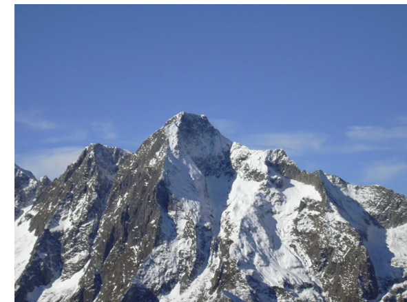
Mont Valier vu du Fonta

Très beau point de vue, en particulier sur le Valier et sa réserve